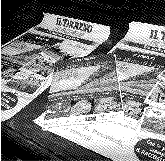
Il materiale della nostra iniziativa (Foto Vip)